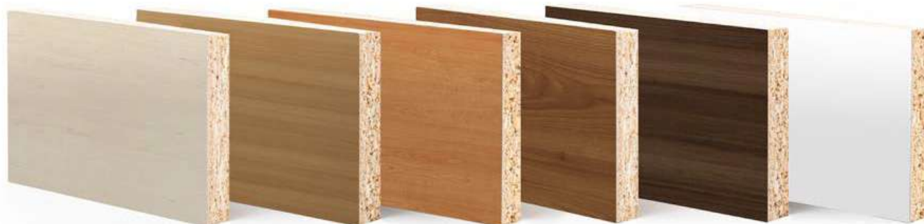
MAPLE Textura: Poro natural