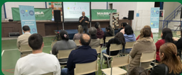
Programa de Medicina Preventiva para colaboradores y comunidad