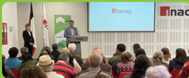
Seminario del Adulto Mayor en San Pedro de la Paz